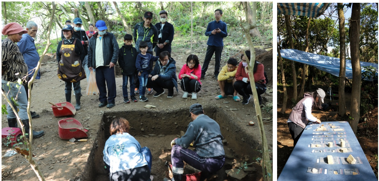
圖 1：花蓮縣萬榮鄉西林村支亞干遺址考古田野場域